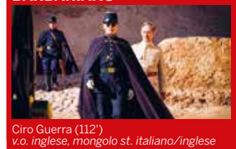
Ciro Guerra (112') v.o. inglese, mongolo st. italiano/inglese

VENEZIA 76 pubblico WAITING FOR THE BARBARIANS