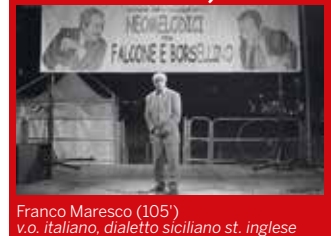
Franco Maresco (105') v.o. italiano, dialetto siciliano st. inglese

VENEZIA 76 pubblico* · tutti gli accreditati LA MAFIA NON È PIÙ QUELLA DI UNA VOLTA (Mafia Is Not What It Used to Be)